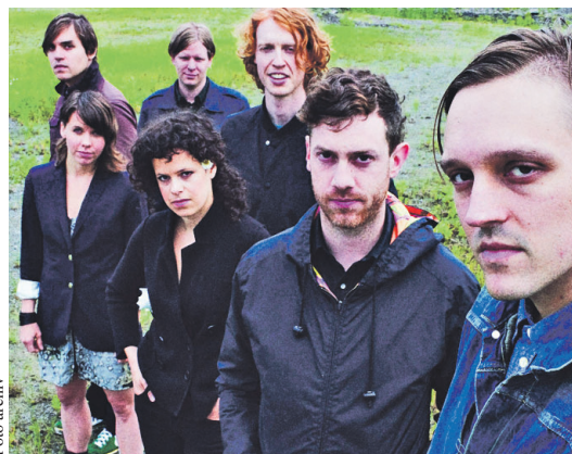
Arcade Fire jsou z Montrealu a existují sedm let.